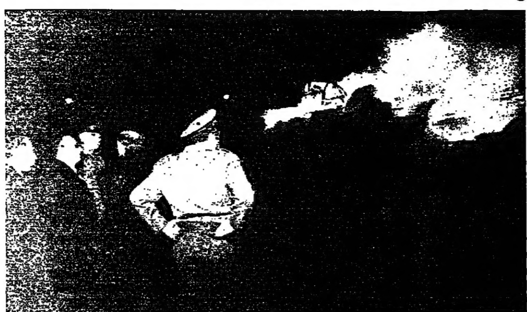
الرئيس المصالح وشباط الاسيرين الحريق